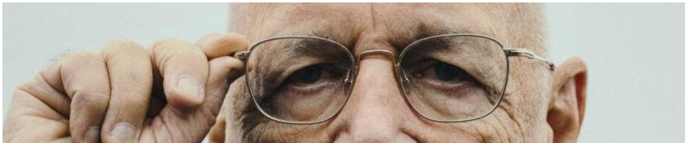
En Klaus keek en zag dat het goed was ...

Dus verwacht ik niet dat de formatie lang gaat duren. De corona-evaluatie gaat verder op de lange baan en Agenda 2030 gaat op dezelfde voet verder. Daar hebben ze Timmermans helemaal niet bij nodig. Sterker: Met deze bezetting gaan de "groene" plannen alleen maar makkelijker door de kamer want alle linkse partijen gaan daar in mee.