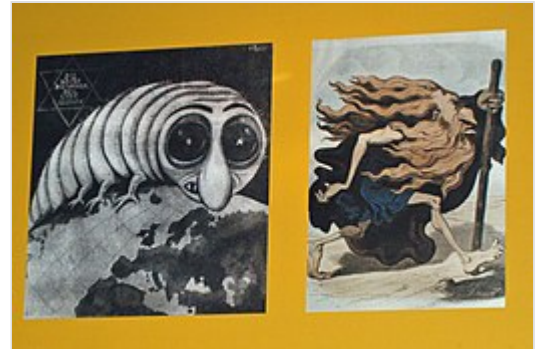
Duitse spotprenten vóór WO II

Antisemieten die zich minder aangetrokken voelden tot de Germaanse mystiek, zoals Georg Ritter von Schönerer , de Oostenrijkse antikatholieke , Joden hatende en anti-Habsburgse nationalist , en de antisemitische burgemeester van Wenen , Karl Lueger , verwierpen de mystieke en sektarische bijeenkomsten en gingen meer voor de 'massabewegingen'. Na het Duitse verlies in de Eerste Wereldoorlog ontstonden veel antisemitische clubs. De bekendste waren de Beierse Thule-Gesellschaft , de Deutsche Arbeiterpartei en de Deutsche Sozialistische Partei . Ook in het dagelijks leven bestond er in Duitsland en Oostenrijk, vooral sinds het midden van de 19e eeuw , een wijd verbreid