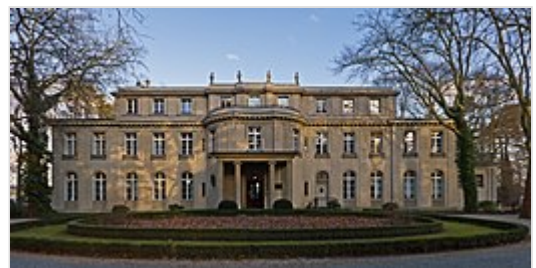
Villa Marlier, locatie van de Wannseeconferentie