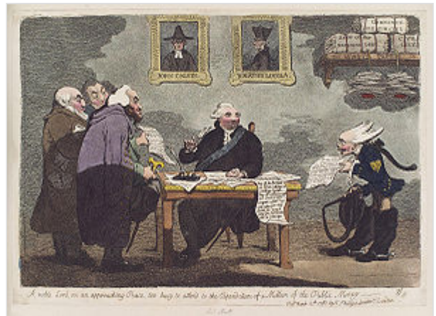
Op deze prent van James Gilray uit 1763 is een aantal antisemitische en antikatholieke vooroordelen samengebracht.