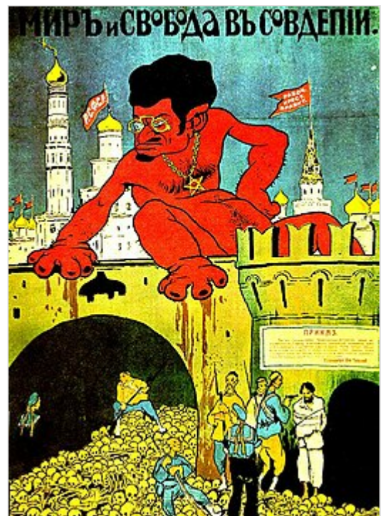
Karikatuur uit Rusland 1919: de Joodse Trotski richt Rusland te gronde

De bolsjewieken leken aanvankelijk het beter met de Joden voor te hebben, en relatief veel Joden sloten zich aan bij de communistische partij. De bekendste van hen was Leon Trotski . Trotski was van Joodse afkomst, maar niet religieus en hij meende dat de joodse religie vanzelf zou verdwijnen, eens het socialisme (communisme) volledig gerealiseerd was. Na de Oktoberevolutie van 1917 werd de Joodse religie onderdrukt door de bolsjewistische communisten . Tussen 1921 en 1925 werden ongeveer 800 synagogen gesloten door de communisten. [52] In april 1921 werden de eerste synagogen gesloten en dat gebeurde in Vitebsk . De plaatselijke Joden protesteerden tegen de sluiting door de gebouwen te bezetten om daar gebedsdiensten te houden. Hierop werden de synagogen aangevallen door de communisten, waarbij tientallen Joodse gelovigen vermoord werden. De communisten riepen: "Dood Smouzen!". [52] Tijdens het Joodse Nieuwjaar in 1921 werd er een showproces georganiseerd door de communisten tegen het Jodendom, waarbij de Joodse religie werd veroordeeld. [52]