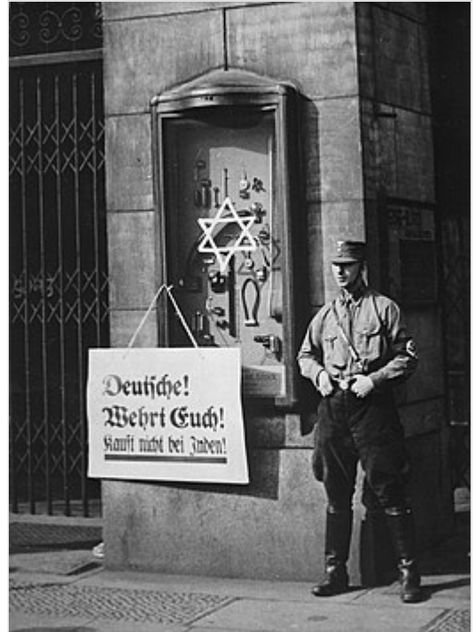
Duitsland 1933: 'Duitsers! Verdedig U! Koop niet bij Joden!'

In Nederland werden na de Eerste Wereldoorlog een aantal kleine autoritaire politieke partijen opgericht, maar zij waren eerder fascistisch dan nationaalsocialistisch of antisemitisch. Initiatieven om extreem-rechtse en antisemitische partijen op te richten werden zeker na de crisis van 1929 genomen, maar deze partijtjes bleken eendagsvliegers die geen politieke macht verwierven.