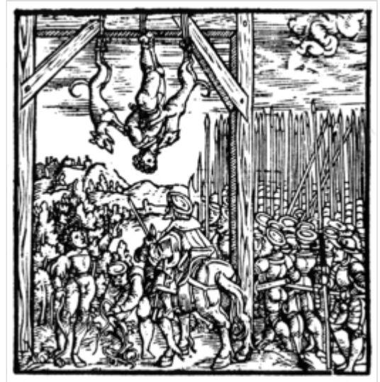
Een Jood werd op een bijzondere wijze opgehangen 15e eeuw

In Europa zijn Joden onder andere slachtoffer van haat geworden door hun vermeende hebzucht. Na het jaar 1000 werden de economische mogelijkheden in West-Europa zeer gunstig, zodat talloze Joden uit het Nabije Oosten zich er gingen vestigen. Christenen mochten door het woekerverbod geen rente vragen voor geld dat zij uitleenden. Joden mochten dat onder anderen wél, op grond van Deuteronomium 23:20-21. Daarom konden Joden bankier worden, die ondernemers een beginkapitaal konden leveren. Vanwege afkomst en huwelijken konden zij beschikken over netwerken. De rijke Joodse bankiers waren echter uitzonderingen: verreweg de meeste Europese Joden waren armlastig, vooral de Joden uit Oost-Europa. [32]