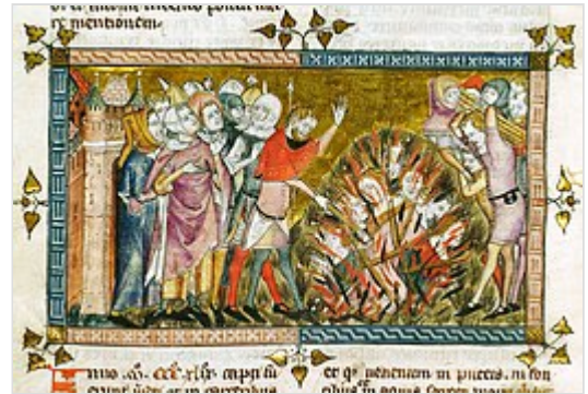
Jodenverbranding in Brabant tijdens de Zwarte Dood

Later uitte Jodenhaat zich vooral als een sociaal verschijnsel en tegen het einde van de 19e eeuw ontstond er zelfs een zogenaamd biologische motivering. Wanneer reacties op Joden een overwegend religieus karakter hebben, wordt er gesproken van anti-judaïsme . Dit anti-judaïsme wordt door sommigen als niet-antisemitisch gezien, maar anderen zien het als dekmantel voor antisemitisme. [26] Slechts op het ogenblik dat vanuit het sociaal darwinisme Jodendom als een ras en niet langer als religie werd beschouwd, werd anti-judaïsme antisemitisme. [27] Het begrip antisemitisme werd door Marr voorgesteld in de context van een meer wetenschappelijke benaming voor het oudere Duitse woord Judenhass (Jodenhaat). Men moet deze