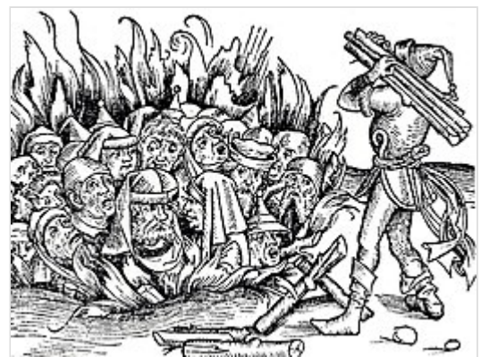
Joden worden verbrand als ketters, 15e eeuw